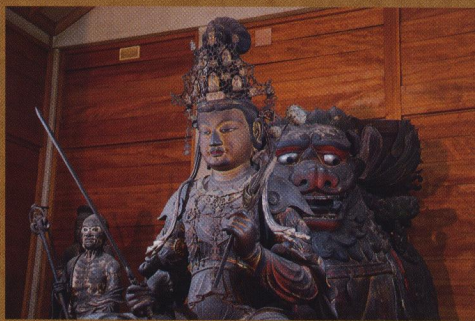
文殊菩薩像【安倍文殊院】 写真安柏文殊院