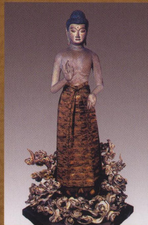
阿彌陀如来立像【随城寺】