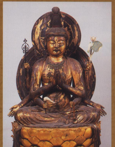
不空罽索観音坐像【不空院】