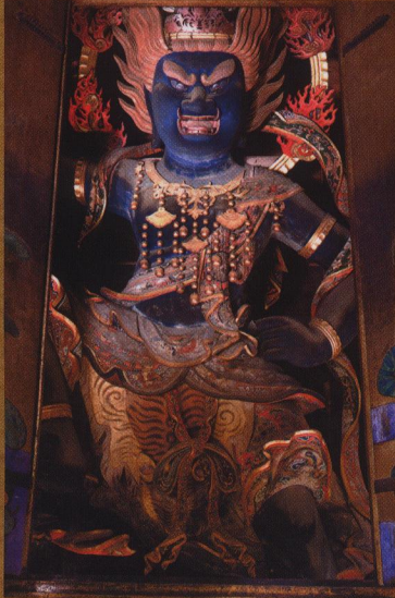
金剛威王権現像(中尊)【金峯山寺】