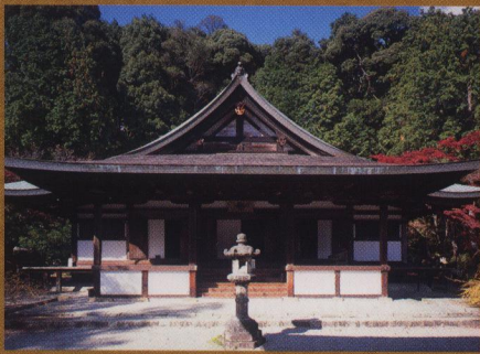
本堂【圓成寺】