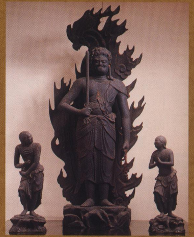
不動明王及二童子立像【十輪院】