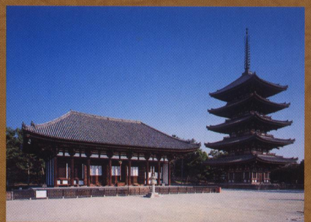
東金堂と五重塔【興福寺】