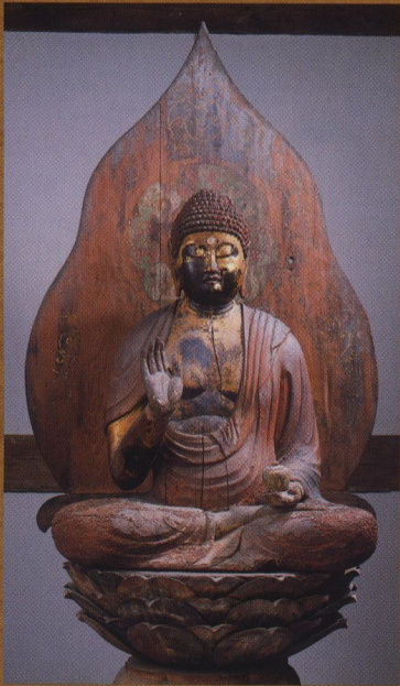
薬師如来坐像【南明寺】