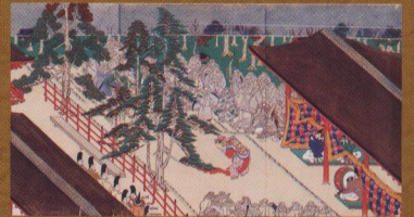
春日本・春日権現験記(部分)【春日大社】