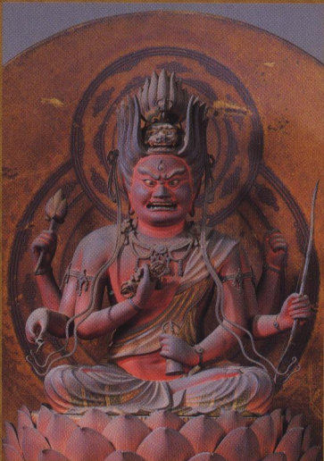
愛染明王坐像【西大寺】